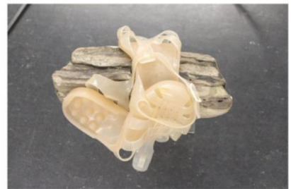
Javier Arbizu, TOOL