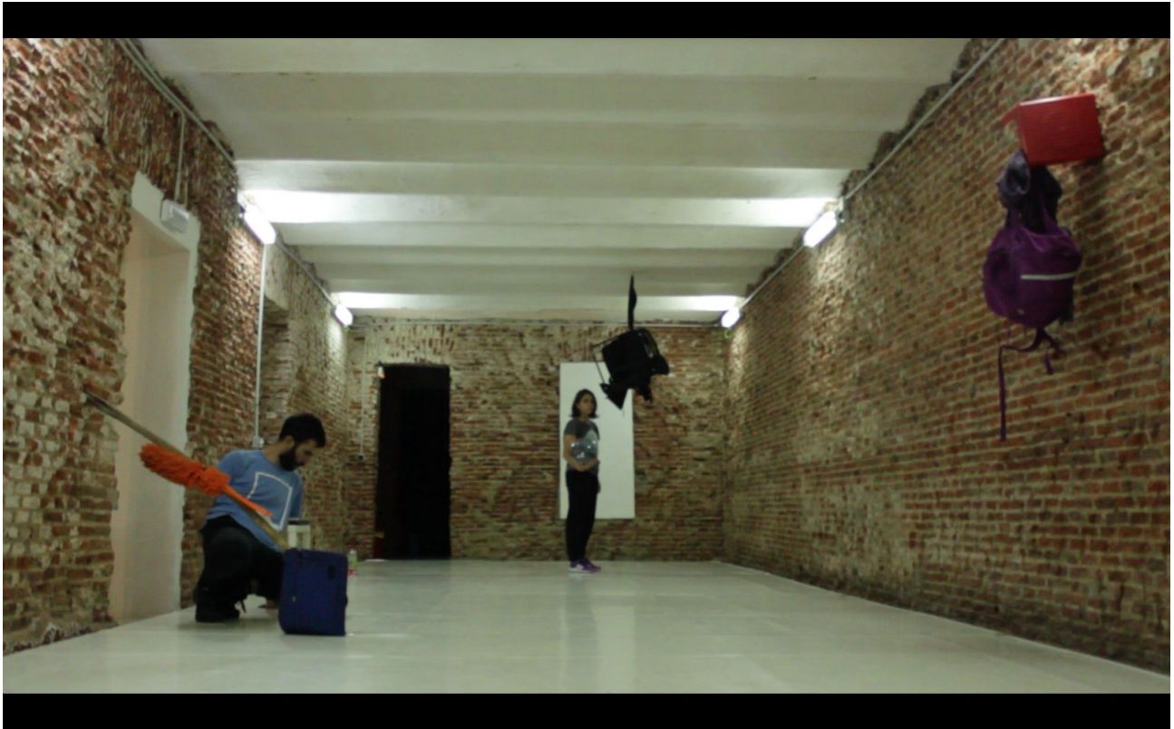
Imágenes de una primera fase de investigación en Espacio DT, Madrid

ESPACIO: Nos interesa el espacio que se genera a partir de esta suspensión, la espera de que “algo” acontezca y la condición de no poder saber exactamente cómo cada acción se realizará.